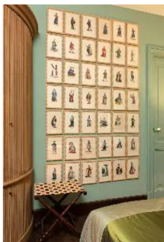
▲ Una delle tre suite della maison di charme Buonanotte Garibaldi, a Trastevere.